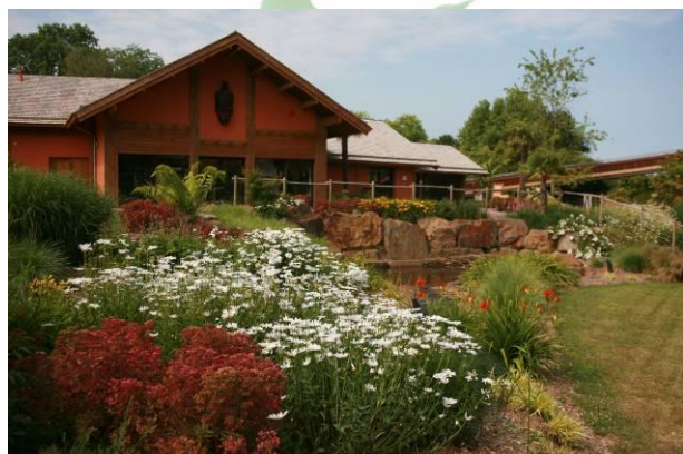
Les jardins de l'accueil

Au parc animalier de Champrepus, au pays de la baie du Mont St Michel, existe un jardin extraordinaire où la faune et la flore sont admirablement mis en scène. Zoom sur cet oasis exotique au cœur de la Normandie... qui mérite le détour !