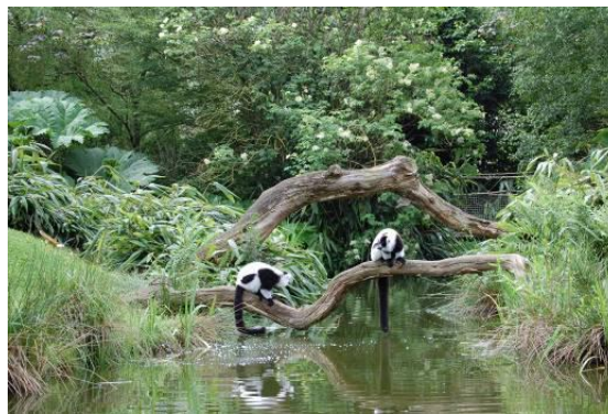
les maki cata dans le jardin malgache