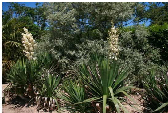
La réserve des lémuriens

savane africaine, île de Madagascar, forêt tropicale, bush australien, végétation luxuriante de Polynésie ... chaque jardin est un passeport vers une destination lointaine. L'exotisme et le dépaysement sont garantis !