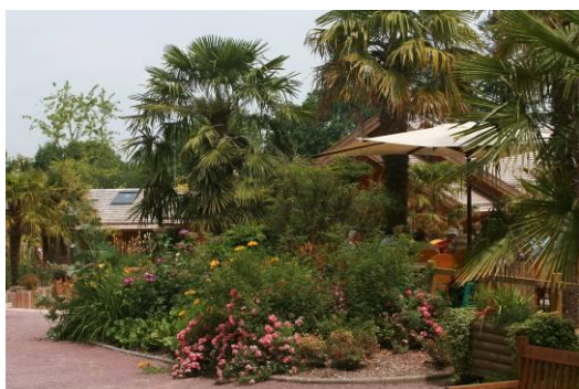
Jardins aux abords de la terrasse du restaurant

Un océan de verdure et de nature, des parfums sucrés, des allées fleuries et colorées, des perspectives paysagères subtiles, les 6 jardins thématiques regorgent de sensations pour la vue, l'ouïe, et l'odorat. Vive la zenitude !