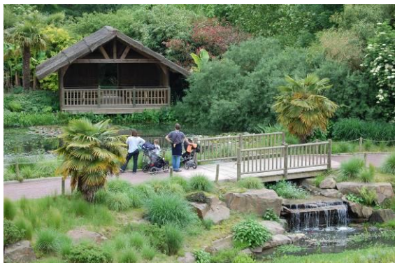
la cascade aux abords de la route

Des moments inédits pourront être immortalisés sur la pellicule... Les makis cata qui font trempette, les lémuriens qui se dorent la pilule au soleil ... dans un décor naturel 100 % malgache !